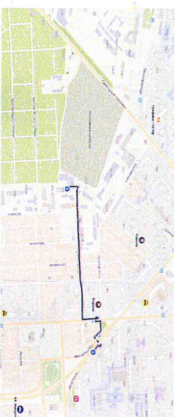
Краевое государственное казённое образовательное учреждение ДПО «Институт региональной безопасности» находится по адресу:

660100, г. Красноярек, ул. Пролетарская, 155. Остановка транспорта: ул. Луначарского, автобусы 2, 12, 14, 43, 49, 11, 80, троллейбусы 5, 13, 15 т. (391) 229-74-74