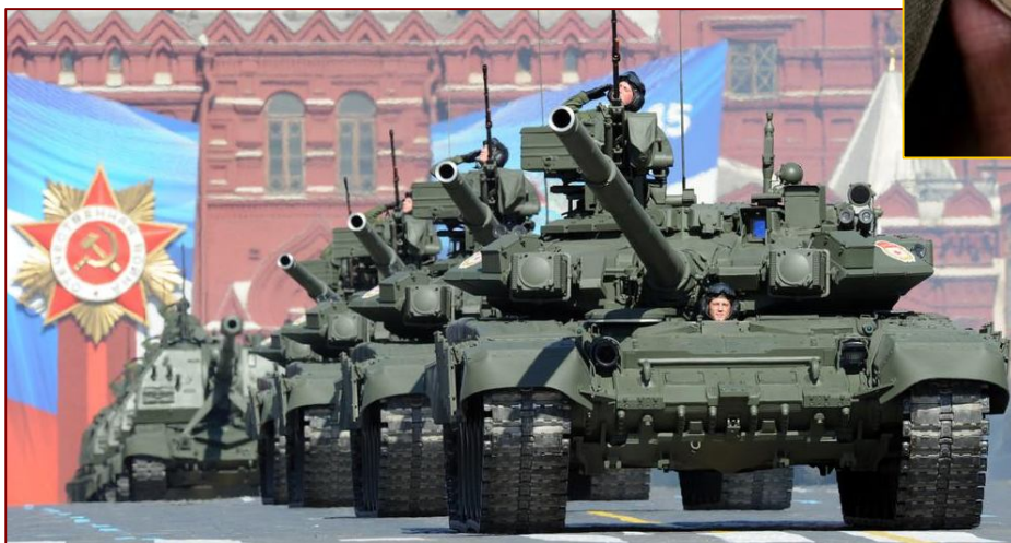
Парад Победы в г. Москва