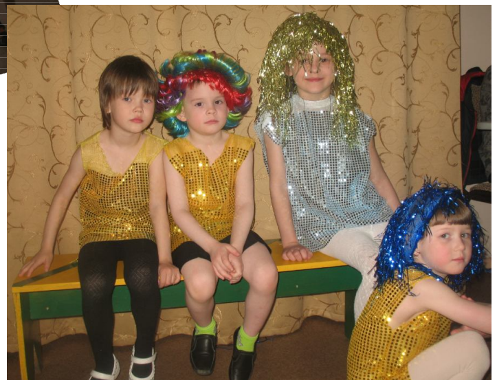
Специальные гости праздника - инопланетяне