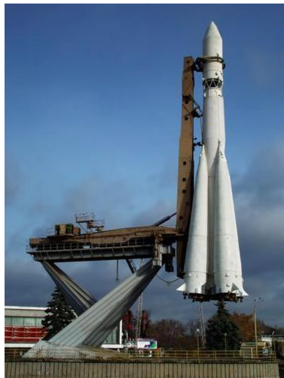
Первый советский космический корабль «Восток»